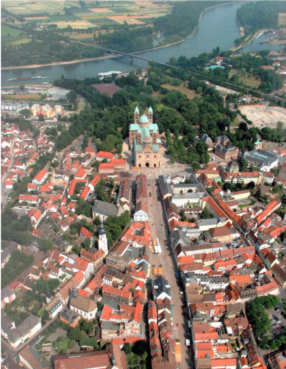
Der Speyerer Dom – Blickfang auf einer Terrasse über dem Rhein