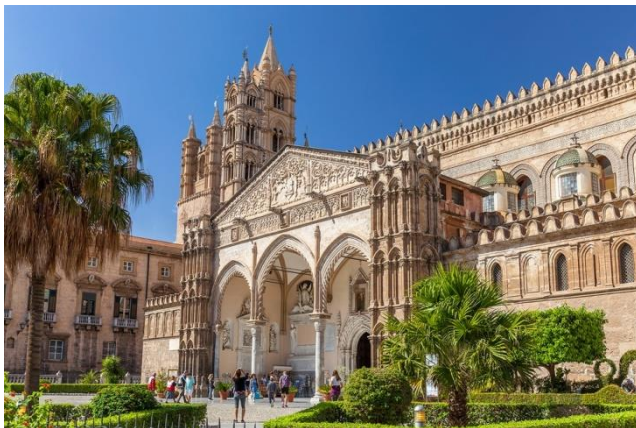
Palermo, normannischer Dom