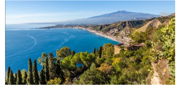
Bucht von Taormina, im Hintergrund der Ätna

„Insel der Sonne“ wurde Sizilien schon in der Antike genannt. Goethe pries es als „Land, wo die Zitronen blühen“. Hier lässt sich wunderbar der Sommer verlängern! Paradiesische Landschaften und ein reiches, jahrtausendealtes kulturelles Erbe ziehen uns in Bann. Unübersehbar thront der Vulkan Ätna über der malerischen Ostküste. Uralte, farbige griechische Mythen umranken die Ost- und Südküste. Hier bewundern wir auch eindruckliche Spuren der geistvollen griechischen Kultur, darunter gut erhaltene antike Tempel. Die Römer hinterliessen in der „Villa Romana del Casale“ die prächtigsten je gefundenen antiken Mosaiken. Im Mittelalter schufen an der Nordküste Araber, Normannen und byzantinische Künstler in einer einzigartigen Symbiose zauberhafte Bauwerke, geschmückt mit betörenden, golden leuchtenden Mosaiken. Eine beschwingte Note hinterliess schliesslich der Barock in einer eigenen sizilianischen Spielart. Die Düfte und Aromen Siziliens widerspiegeln sich auch in den kulinarischen Spezialitäten. Zu dieser stilvollen Reise passen unsere schönen, romantischen Vierstern-Hotels. Selbstverständlich werden wir sorgfältig die Schutzkonzepte gegen Covid-19 beachten.